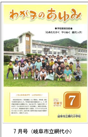
7月号(岐阜市立網代小)