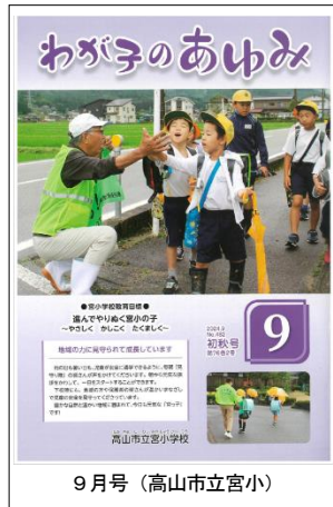
9月号(高山市立宮小)