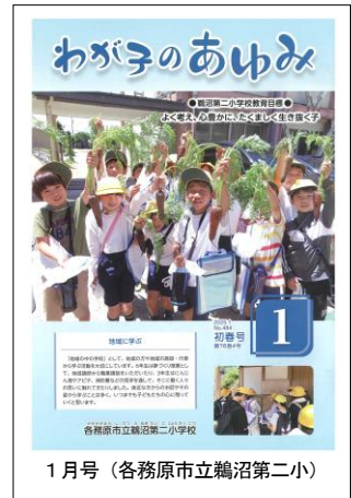
1月号(各務原市立鷺沼第二小)