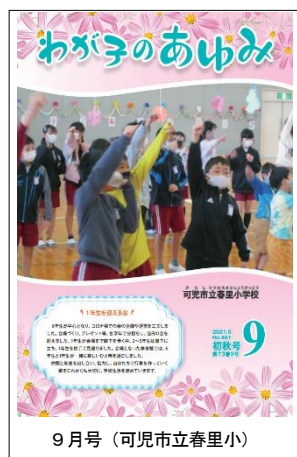
9月号(可児市立春里小)