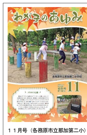
11月号(各務原市立那加第二小)