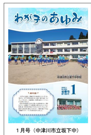
1月号(中津川市立坂下小)